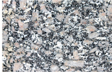
Échantillon de granite