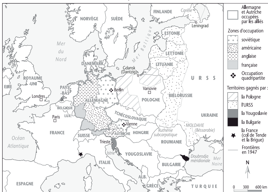
L'Europe en 1947