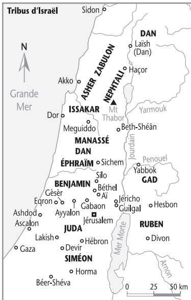
Les tribus au temps de la conquête.