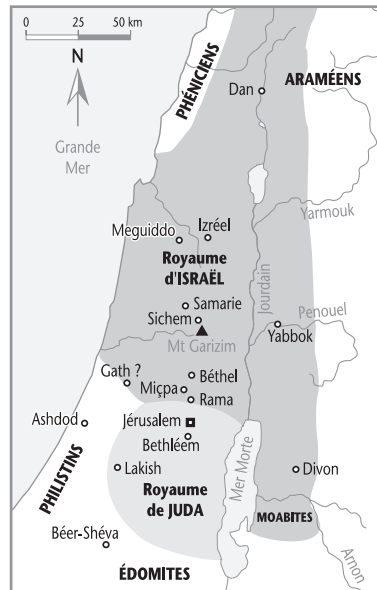
Israël et Juda après le schisme.