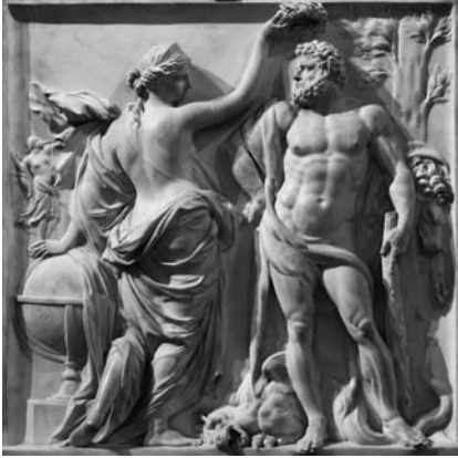
Hercule couronné par la Gloire, Martin van den Bogaert, dit Desjardins. Marbre, 1671, pièce de réception pour l'Académie royale.