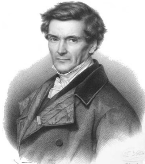
Gaspard-Gustave de Coriolis (1792-1843)

Les tireurs d'élite remplissent des missions d'observation et de neutralisation à longue distance. Discrets et travaillant au sein d'une petite équipe, leurs tirs visent des cibles à une distance pouvant dépasser le kilomètre. À une telle distance, le sang-froid ne suffit plus et plusieurs paramètres météorologiques sont à prendre en compte : vent, température et humidité notamment. Un autre paramètre, appelé déviation de Coriolis et dû à la rotation de la Terre, affecte la précision du tir. Voyons quelle peut être son influence.